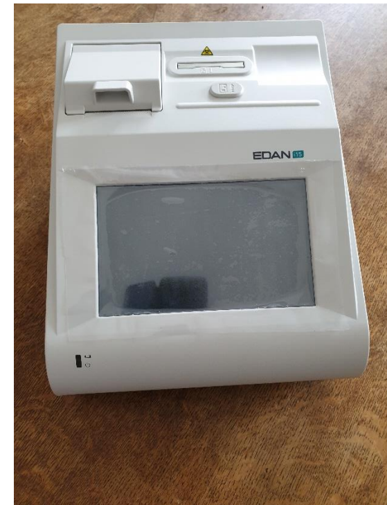
Analyseur de sang, élément-clé pour le suivi des patients

* En rouge, les équipements bloqués à Lyon en raison du confinement