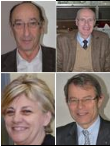
Club de Lyon Nord Club International