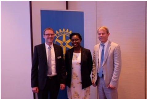
Club de Bad Kissingen