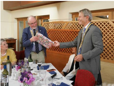
Club Oxford North