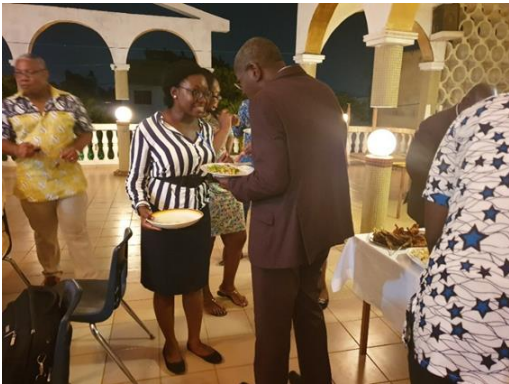
Club de Lomé Perle Club Hôte